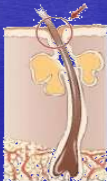
A szőrtüsző kivezető nyílása eltömődik