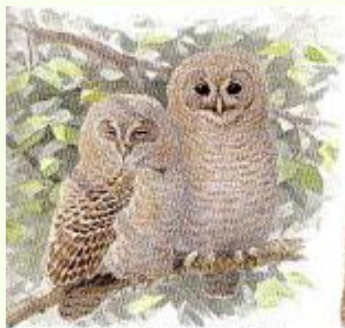
két kb. 4 hetes fiatal fióka (fent)